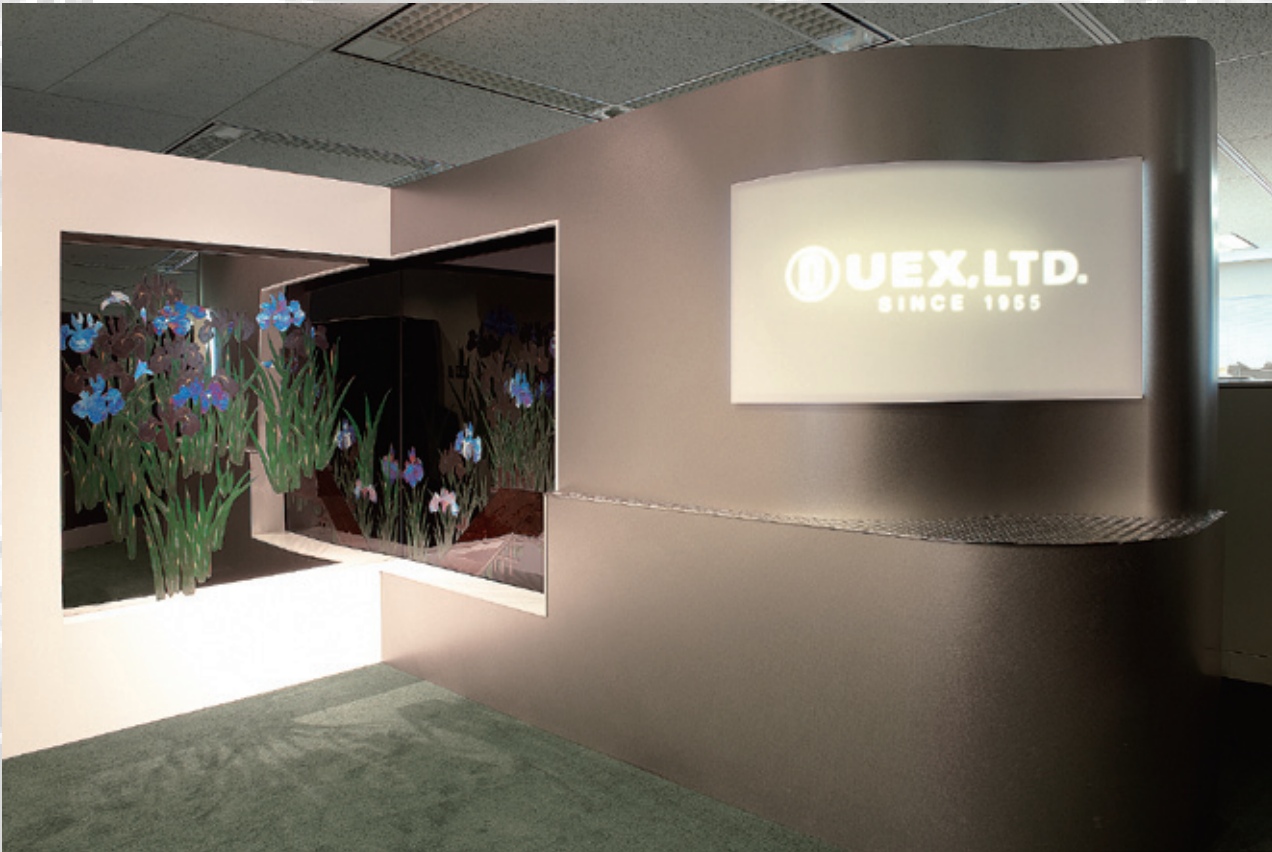
Après l'aménagement Réception de l'UEX, Ltd. Titane Maki-e «Iris Kakitsubata»